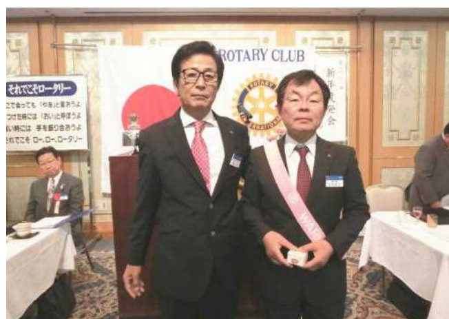
前会長・幹事に記念バッジ贈呈