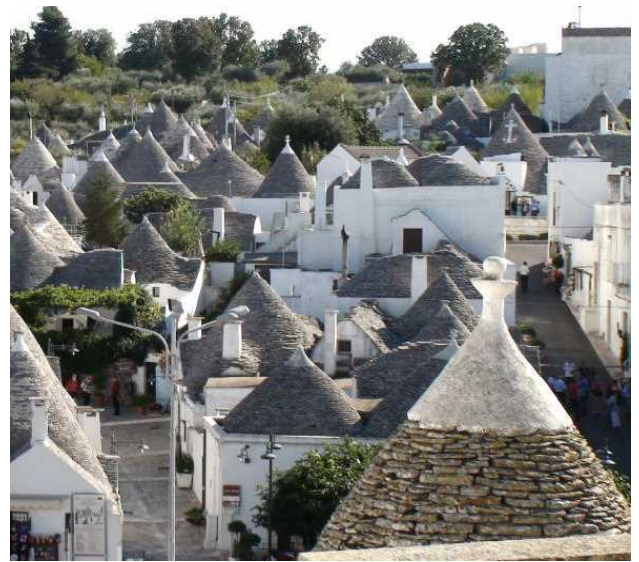
沢山のトゥールッコ

バーリの近隣には沢山のトゥールッリ（とんがり屋根の住居）がありますが、アルベロベッロほど沢山のトゥールッリが残っている村落はありません。約1600軒あるそうです。トゥールッリはトゥールッコの複数形です。とんがり屋根の住居は数棟が寄り集まって1軒の家となっています。トゥールッコのてっぺんにちよこんと乗っかっている物をピナクルと言います。