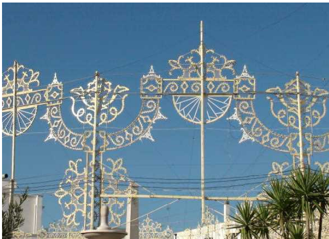
ルミナリエの原型

バーリの近隣には沢山のトゥールッリ（とんがり屋根の住居）がありますが、アルベロベッロほど沢山のトゥールッリが残っている村落はありません。約1600軒あるそうです。トゥールッリはトゥールッコの複数形です。とんがり屋根の住居は数棟が寄り集まって1軒の家となっています。トゥールッコのてっぺんにちよこんと乗っかっている物をピナクルと言います。