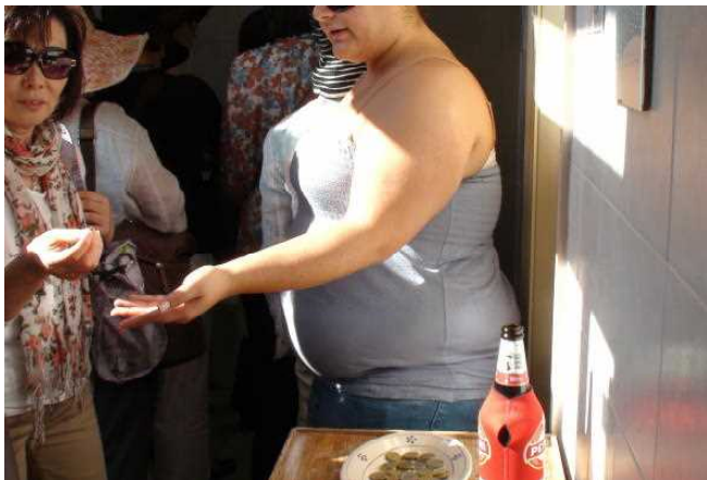
トイレで集金する人