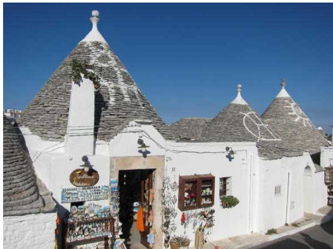
村の中にも至る所に土産物店が

村の入り口に近づくと沢山の土産物屋があります。ここにしか売っていない記念品を買い込んで、集合場所に集まります。駐車場まで歩き、バスに乗ってクルーズ船に戻ります。アルベロベッロにはなかなか行けないので、このツアーでは最も行きたい場所の一つで、良い記念になりました。