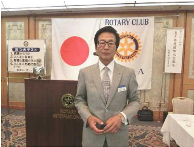
8 東海広光君に第1回マルチプル・ポール・ハリス・フェローピンが参りました。