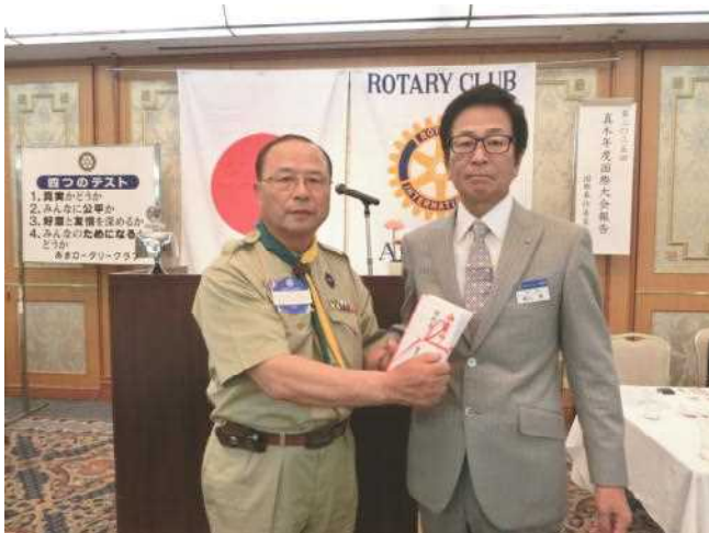
ボーイスカウト・ガールスカウトへ助成金贈呈