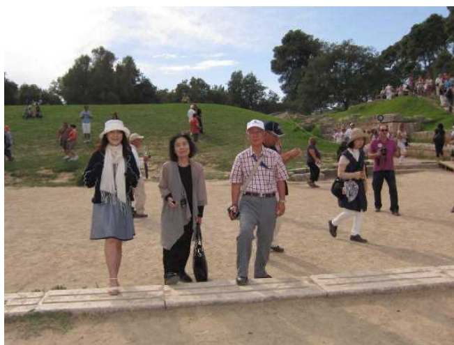
オリンピアスタートライン