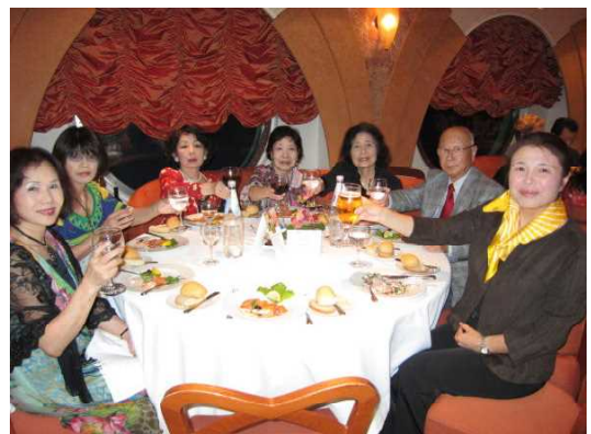
皆さんから祝福を