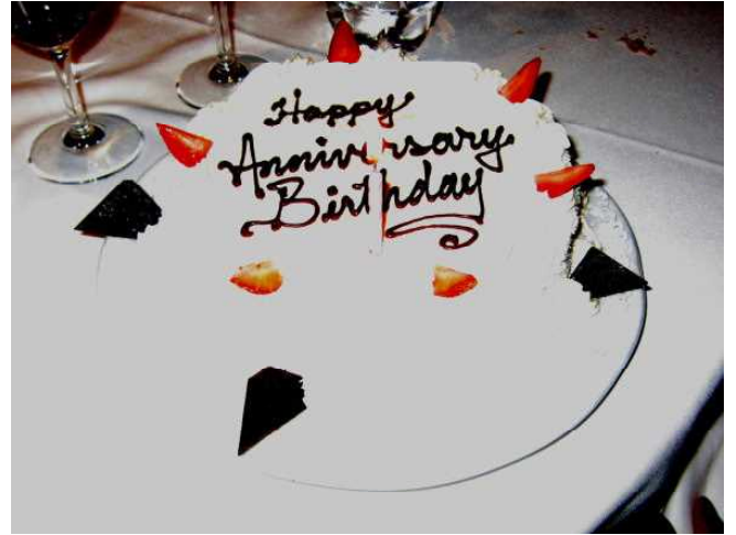
金婚式と誕生日のケーキ