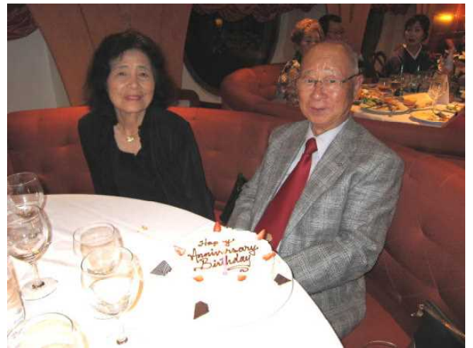
金婚式のケーキの前で