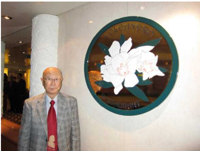
レストランの前で