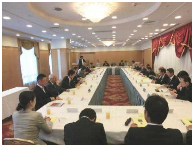
アッセンブリー風景