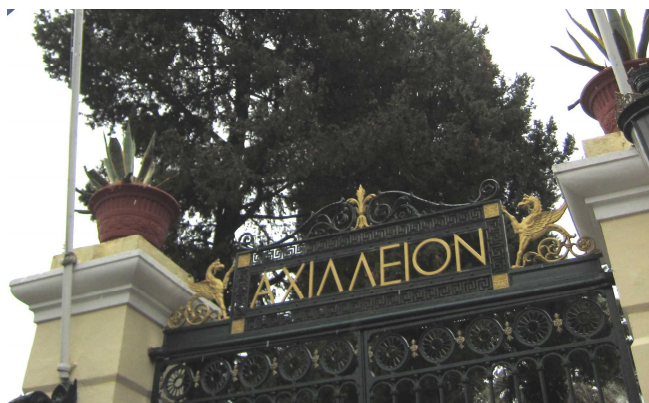
アヒリオン宮殿正門