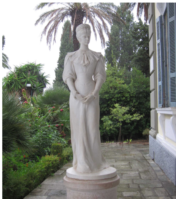
エリザベート皇女の像