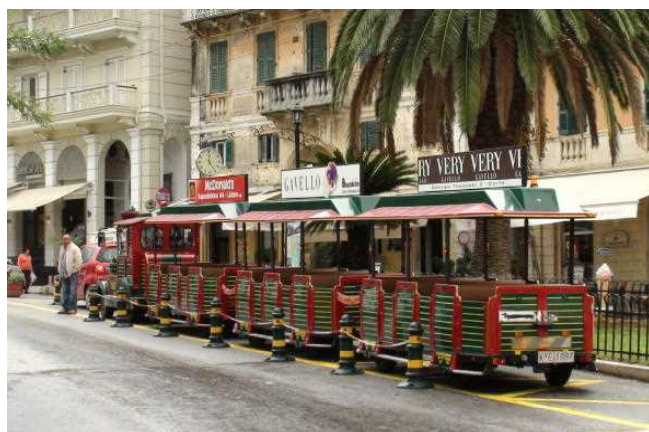
市街地観光用バス