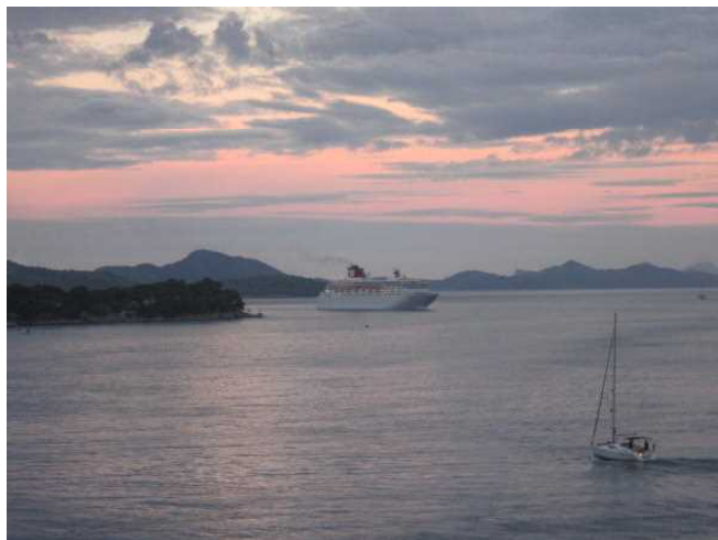
早朝のアドリア海

10月13日の朝を迎えました。東の空は朝焼けです。クロアチアに近づくと斜張橋が姿を現します。間もなくドブロヴニクに寄港します。