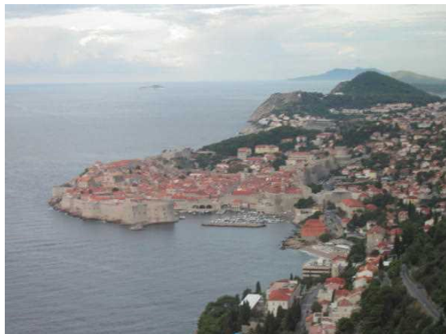
街全体を見渡せる場所で記念撮影

ムジカは朝7時にドブロヴニクのグルージュ港に寄港しました。我々は8時に港をバスで出発して、ケーブルカーの乗り場に向かいます。ドブロヴニクは未だEUに加盟して居なかったので、パスポートが必要です。