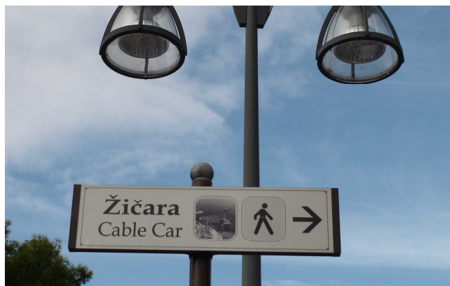
ケーブルカーの乗り場の案内