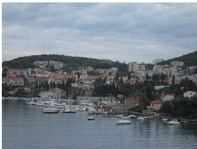
船上からドブロヴニクを望む

ドブロヴニクは「アドリア海の真珠」と呼ばれており、石造りの宮殿、ベネチア様式の建物が残っています。旧市街は石の城壁に囲まれており、街全体が世界遺産に登録されています。