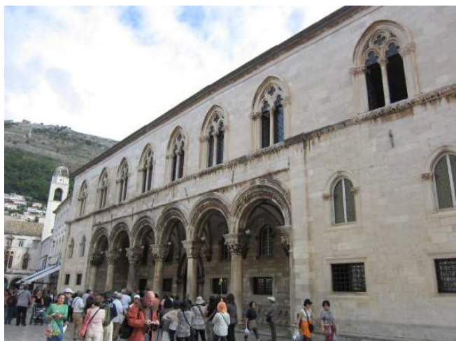
旧総督邸 現文化歴史博物館