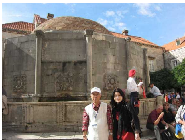
オノフリオの大噴水