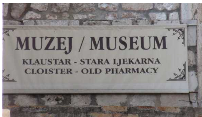
通りにある美術館の看板