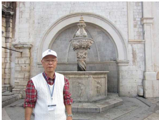
オノフリオの小噴水

青空市場を見学してから、ルジャ広場に戻って、メインストリートであるプラツァ通りを西に向かいます。プラツァ通りの突き当たりの左側にオノフリオの大噴水があります。大噴水の前の狭い路地を入ると美術館があります。