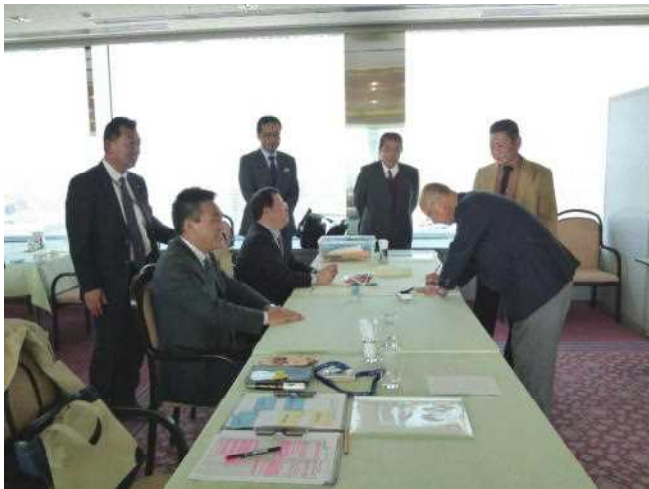
ニコボックス風景