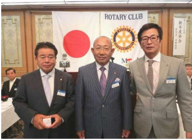
前会長・幹事に記念バッジ贈呈