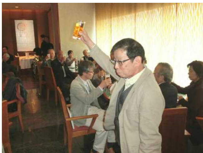
乾杯の発声は紅谷社会奉仕委員長