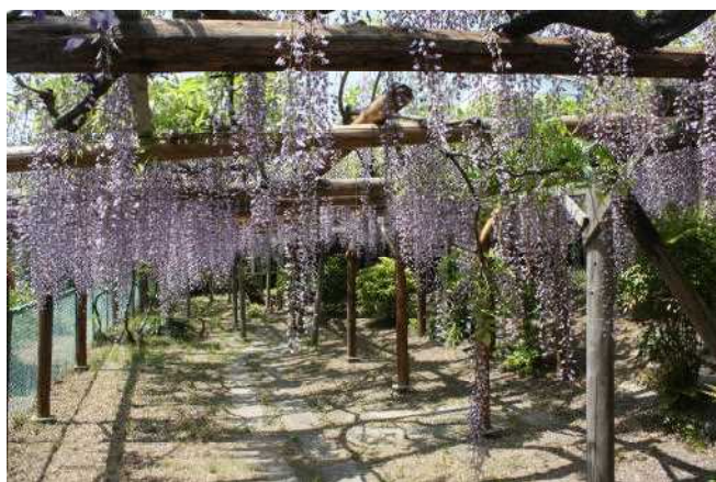
新川の堤防沿いに樹齢350年と伝わるフジの木があり、

県天然記念物に指定される。萱津のオオフジと呼ばれ、開花時期には大勢の見物客で賑わった。しかし東海豪雨による被害および新川の護岸工事の影響で、樹勢が衰えここ十年ほど一般公開を見送ってきたが、平成25年度より地元の厚い要望を受け、「思い出が語れるフジ！」として公開を再開し2日間限定ではあるが、今も多くの見学者でにぎわっている。今年度は4月29日、30日に一般公開する。(雨の場合は中止)