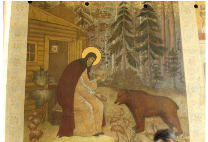
聖人セルギエフの絵