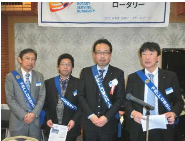
親睦活動委員会合唱団の方々