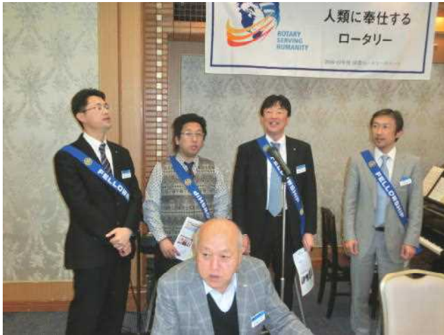
親睦活動合唱団の皆様