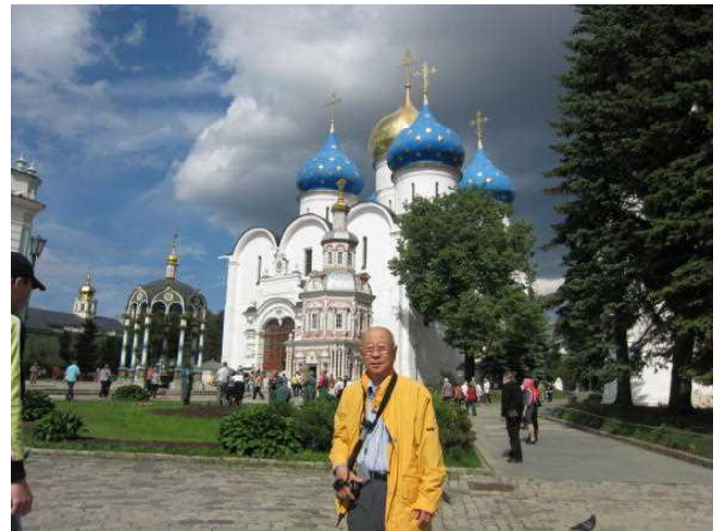
ウスペンスキー大聖堂