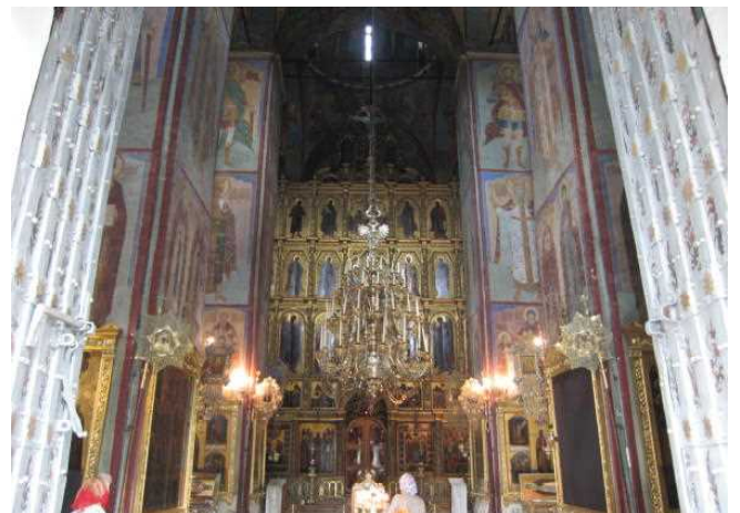
ウスペンスキー大聖堂の内部