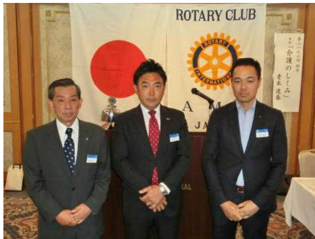
蟹江学戸ホテルの会へ助成金進呈